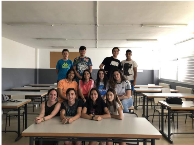
Alumnos de francés de 4º ESO. Curso 2018/19